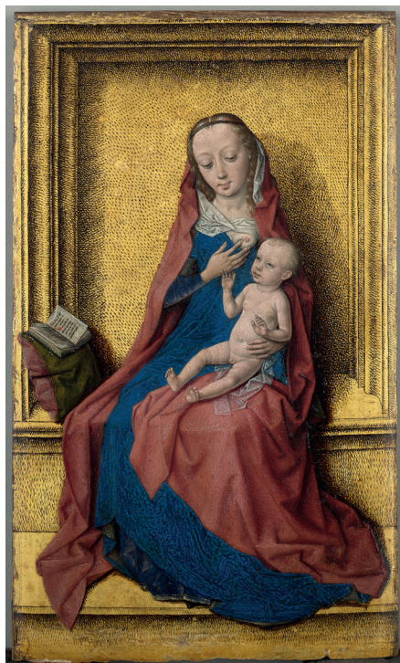
'Maria met Kind zittend in een stenen nis', Dieric Bouts, 1468-1475 Beyoncé op de 59e Grammy Awards, 12 februari 2017

Dieric Bouts schilderde verschillende voorstellingen van Maria met Kind. Het zijn iconische beelden die ook vandaag nog inspireren.